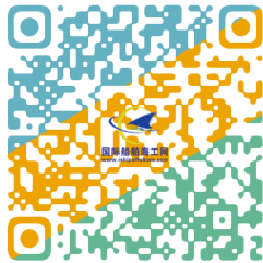
LNG 动力船和装备上海峰会

会议信息可扫码或访问链接： http://www.ishipoffshore.com/html/1/2022-04-28/15527.htm