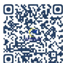
LNG Terminal Summit 2022